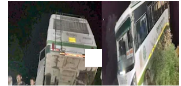
PHOTOS: सड़क से आधी बाहर लटकी HRTC बस, 24 सवारों की जान बाल-बाल बची